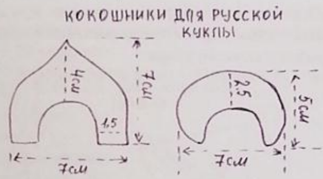
Схема-выкройка головного убора.

Коромысло делается так же из проволоки, как и руки, отмеряется нужная длина, обматываем шпагатом и формируем коромысло. Ведерки делаем из пластиковых маленьких стаканчиков. Срезаем верх, оставляем нужный размер для ведер, обматываем их шпагатом, предварительно промазывая клеем «Титан» и украшаем тесьмой. Каравай изготавливаем из газеты. Формируем комочек, обматываем скотчем, затем шпагатом и украшаем узорами из шпагата. Кукла готова.